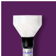
50MM PIEZA DE MANO HAZ AMPLIO