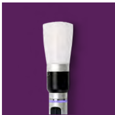
25MM PIEZA DE MANO ZOOM