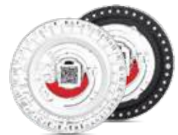
Rotor Circular de Reagentes