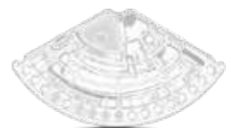
Rotor de reagente do setor